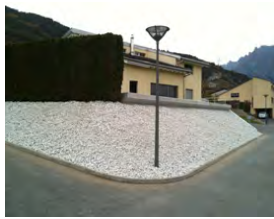
CELLULE DE REPLISSAGE