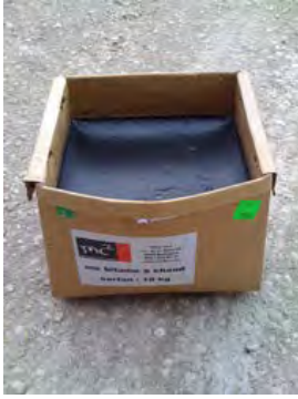
MASSE DE BITUME