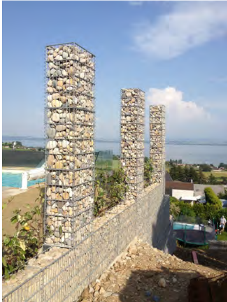
VERSTÄRKTE DOPPELDRAHT- GABIONEN