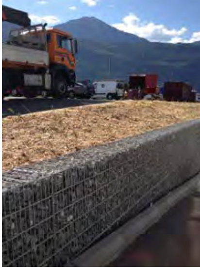
VERSTÄRKTE DOPPELDRAHT- GABIONEN